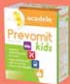
Prevomit Kids x 6 nyálóka

A kellemetlen tünetek (émelygés, szédülés), utazási betegség vagy magasság által okozott rosszullét csökkentésére