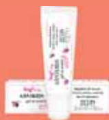
Arnikids árnika gél x 20 ml

Rovarcsipés, ütés, zúzódás, izomfájdalom esetére