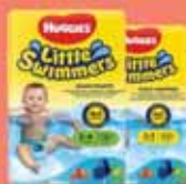
Huggies vízhatlan gyerek pelenkák